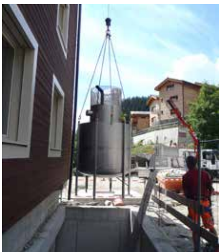
Das Filtermodul der Abwasserwärmerückgewinnung wird im Schacht positioniert.