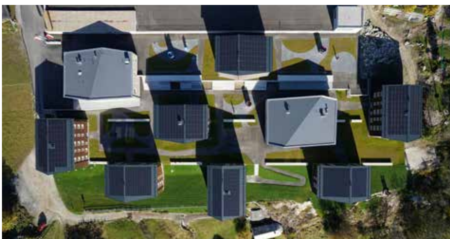
Vier der neun Gebäude des Reka-Feriendorfs Blatten-Belalp sind mit Hybridmodulen ausgerüstet, drei weitere Gebäude mit PV-Modulen.

Wer im neu eröffneten Reka-Feriendorf in Blatten seinen Urlaub verbringt, profitiert von der Sonne gleich doppelt. Er kann am Walliser Südhang die wärmenden Strahlen geniessen. Und er nutzt die Sonne indirekt, denn die Feriensiedlung deckt über zwei Drittel ihres Energiebedarfs mit der Sonne. Hybrid-Sonnenkollektoren produzieren Warmwasser und Strom.